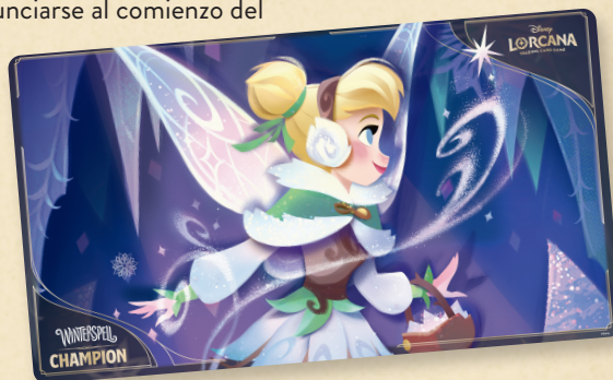
Tapete de juego de campeón de Tinker Bell – Snowflake Collector