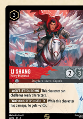
Carta promozionale Li Shang – Appena Promosso