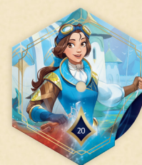
Contatore leggenda Belle – Meccanica Straordinaria