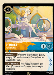
Carta promozionale Peggy – Madre Giocosa