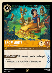
Carta promozionale Biancaneve – La più Bella del Reame