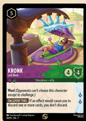
Carta promozionale Kronk – Rilassato