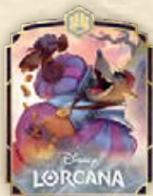
Pin de Sheriff of Nottingham – Corrupt Official