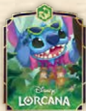
Pin de Stitch – Covert Agent