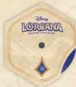
Contador de leyenda

Por favor, ten en cuenta que este kit y su contenido no están destinados a la reventa. Para más información, por favor, consulta los Términos y Condiciones del Programa de Hobby Stores de Disney Lorcana .