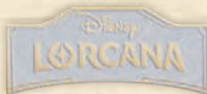
Pin del logo de Disney Lorcana