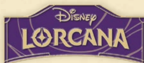
Spilla con logo Disney Lorcana