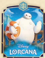
Spilla Baymax — Operatore Sanitario Personale