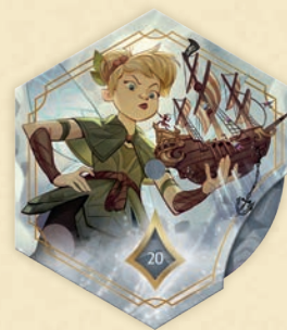
Contador de leyenda de Tinker Bell – Giant Fairy

Por favor, ten en cuenta que este kit y sus contenidos no están destinados a la reventa. Para más información, por favor, consulta los Términos y Condiciones del Programa de Tiendas de Hobby de Disney Lorcana .