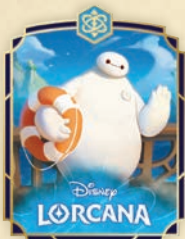
Pin de Baymax – Personal Healthcare Companion