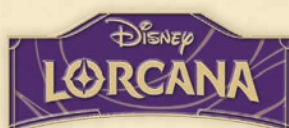
Pin del logo de Disney Lorcana