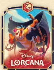
Pin de Tigger – In the Crow's Nest