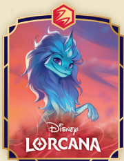
Spilla Sisu – Guerriera Rincuorata