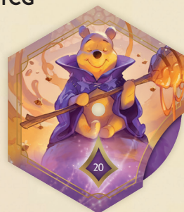
Contatore leggenda Winnie the Pooh – Mago del Miele

Si prega di notare che questo kit e il suo contenuto non sono destinati alla vendita. Per maggiori dettagli, fai riferimento a termini e condizioni del programma Hobby Store di Disney Lorcana .