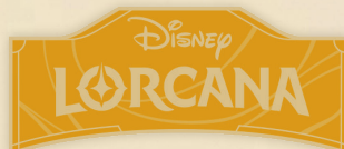
Spilla con logo Disney Lorcana