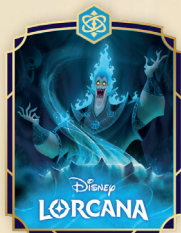
Spilla Ade – Cospiratore Infernale