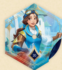
Contador de leyenda de Belle – Mechanic Extraordinaire