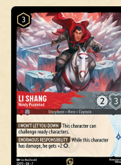
Carta promocional Li Shang – Newly Promoted