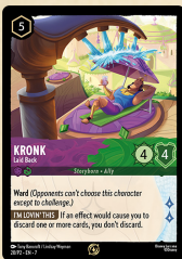
Carta promocional Kronk – Laid Back