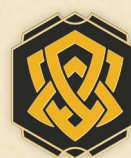
Pin de tinta Ámbar Disney Lorcana