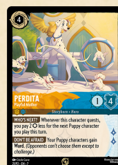
Carta promocional Perdita – Playful Mother