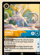
Perdi – Verspielte Mutter Promokarte