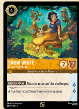
Schneewittchen – Die Schönste im Land Promokarte