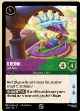
Kronk – Entspannt Promokarte