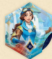
Belle – Außergewöhnliche Mechanikerin Legendenmarker